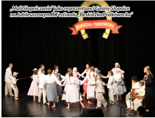
„Mali Stopniczanie” jako reprezentanci Gminy Stopnice na Jubileuszowym XI Festiwalu „Beskidzka Podkowiecka”