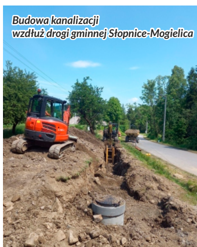
Budowa kanalizacji wzdłuż drogi gminnej Słopnice-Mogielica

W sołectwie Mogielica wykonano sieć kanalizacji sanitarnej o łącznej długości 4406 mb, która pozwoli na odprowadzanie i oczyszczenie ścieków z 52 posesji osiedli: Kukuczki, Spądówka, Smagi, Pierzchały, Leśne oraz Wróble. Wykonawcą zadania była firma „Hydrotech Plus” z Pisarzowej. Wartość inwestycji wyniosła 1 013 257 zł.