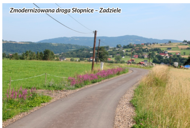
Zmodernizowana droga Słopnice – Zadziele

Zmodernizowaną drogą gminną mogą cieszyć się również mieszkańcy osiedla Zadziele w sołectwie Granice. W ramach remontu tej drogi wykonano konieczne roboty związane z jej odwodnieniem oraz położono nową nawierzchnię asfaltową na całej drodze długości 1125 mb. Wartość inwestycji wyniosła 297 874 zł. Wykonawcą była firma „Limdrog” z Limanowej. Na realizację zadania samorząd gminy pozyskał środki finansowe z budżetu państwa w ramach Funduszu Dróg Samorządowych w kwocie 206 187 zł.