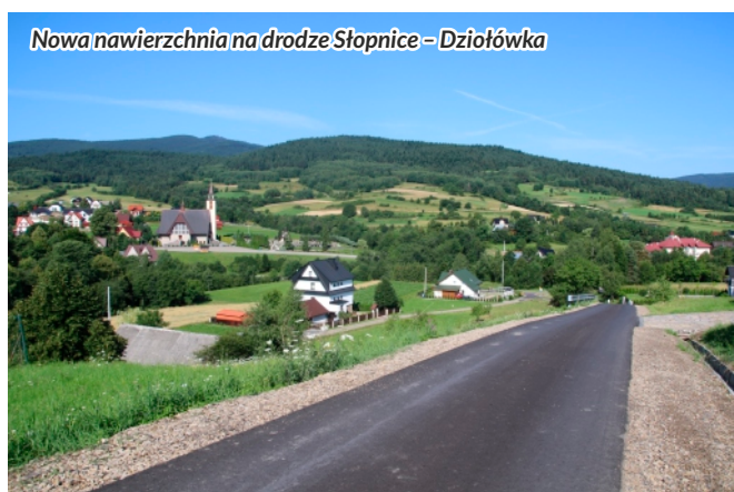
Nowa nawierzchnia na drodze Słopnice – Dziołówka