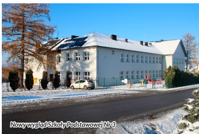
Nowy wygląd Szkoły Podstawowej Nr 3

Ponadto w ramach termomodernizacji szkół wykonano instalacje fotowoltaiczne na budynku Zespołu Placówek Oświatowych i Szkoły Podstawowej Nr 3.