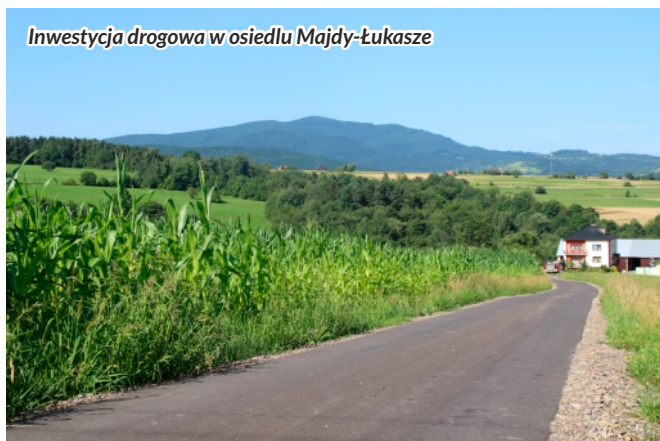
Investycja drogowa w osiedlu Majdy-Łukasze

wewnętrznych w osiedlach: Podgórze, Wikarówka, Wójtostwo, Kukuczki, Pierzchały, Piechury, Rola-Konickie, Śliwówka, Pokusówka, Kowalówka, Kowalówka-Garcarzówka, Dziołek, Majdy-Łukasze, Rola, Głębiec, Białonoga, w osiedlu Zapotocze dwa odcinki oraz dwa odcinki w osiedlu Przylaski na łącznej długości powyżej 8,5 km. Zakres robót obejmował modernizację odwodnienia i nawierzchni dróg co w efekcie poprawiło ich walory użytkowe oraz estetyczne. Wartość robót wyniosła 1 847 519 zł. Generalnym wykonawcą zadania była firma „Drogbud” ze Słopnic, natomiast podwykonawcą odpowiedzialnym za wykonanie nawierzchni asfaltowych była firma „Limdrog” z Limanowej.