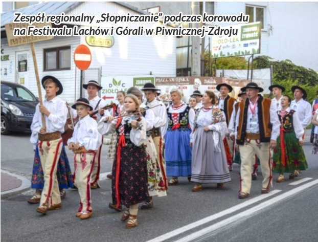
Zespół regionalny „Stopniczanie” podczas korowodu na Festiwalu Łachów i Górali w Piwnicznej-Zdroju