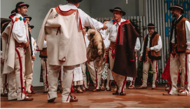
Podczas 52. Festiwalu Folkloru Górali Polskich w Żywcu w programie „Łossodl – rozdziałowiec na św. Michała” zespół regionalny „Stopniczki Zbyrcok”