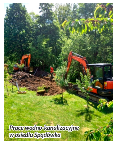
Prace wodno-kanalizacyjne w osiedlu Spądówka