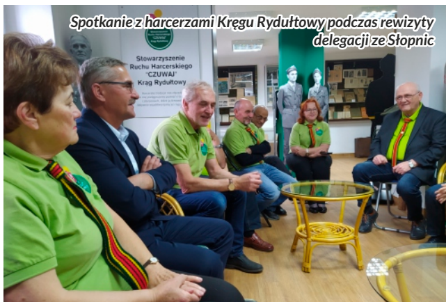
Spotkanie z harcerzami Kręgu Rydułtowy podczas rewizyty delegacji ze Słopnic

Pierwszy kontakt Gminy Słopnice z harcerzami z Rydułtów został nawiązany cztery lata temu, kiedy to przybyli do Słopnic przemierzając śladami dawnych obozów harcerskich harcerzy kręgu Rydułtowy. To właśnie wtedy okazało się, że pomnik posadowiony w centrum Słopnic wbrew stawianym hipotezom nie jest symboliczną mogiłą zastrzelonego przez Moskala Legionisty, który miał być uczestnikiem bitwy pod Jabłońcem, lecz trwałą pamiątką pobytu Harcerzy Kręgu Rydułtowy w naszej miejscowości w sierpniu 1931 roku. Pomnik zadedykowano nieznanemu żołnierzowi walk o niepodległą ojczyznę z lat pierwszej wojny światowej. W podziękowaniu za opiekę nad obeliskiem i z wyrazami szacunku dla mieszkańców Słopnic za otoczenie tego miejsca pamięcią, Gmina Słopnice otrzymała honorową Odznakę Ruchu Przyjaciół Harcerstwa, którą złożył na ręce Wójta Gminy Słopnice podczas rewizyty naszej delegacji w Rydułtowach w październiku 2021 roku.