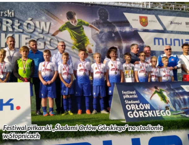
Festiwal piłkarski „Śladami Orłów Górskiego” na stadionie w Stopnicach

Zdjęcia pochodzą z prywatnych zbiorów organizacji pozarządowych, szkół oraz archiwum Starostwa Powiatu Limanowskiego.