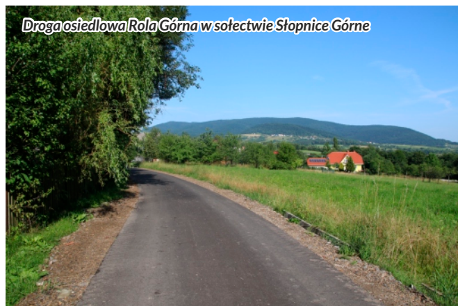
Droga osiedlowa Rola Górna w sołectwie Słopnice Górne