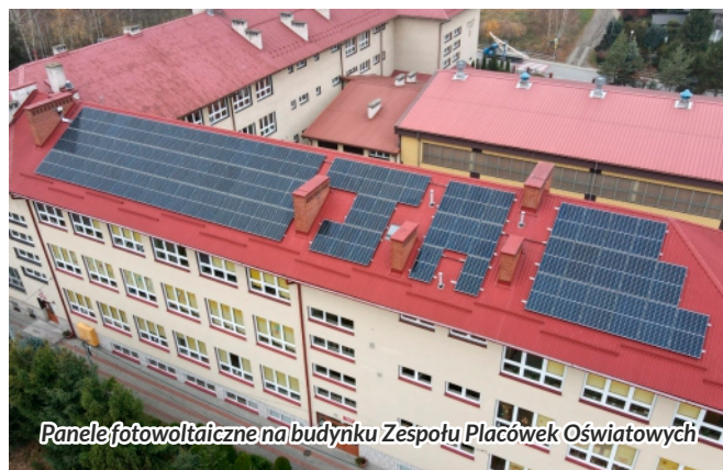
Panele fotowoltaiczne na budynku Zespołu Placówek Oświatowych

Na dachach budynków szkół zamontowano łącznie 143 szt. paneli fotowoltaicznych. Na budynku Zespołu Placówek Oświatowych wykonano instalację o mocy 44,25 kW, natomiast instalacja o mocy 9,38 kW zasili budynek Szkoły Podstawowej Nr 3. Zadanie zrealizowała firma „Instalatorstwo Elektryczne Telemechanika Andrzej Gawrych” z Łukowicy. Całkowity koszt zadania wyniósł 197 045 zł.