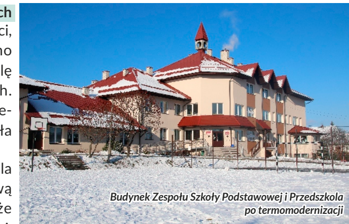
Budynek Zespołu Szkoły Podstawowej i Przedszkola po termomodernizacji

Prace termomodernizacyjne objęły również budynek Szkoły Podstawowej Nr 3, w którym wymieniona została stolarka okienna, a ściany zewnętrzne oraz strop zostały docieplone. Szkoła zyskała nowy wygląd za sprawą pomalowanego dachu. W ramach zadania pomalowano część pomieszczeń, a podsufitki i rynny