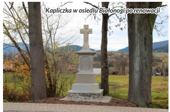
Treść inskrypcji znajdującej się na kapliczce

Gmina Słupnice pozyskała dofinansowanie na remont kapliczki umiejscowionej w osiedlu Białonogi w ramach konkursu pn. „Kapliczki Małopolski 2021”. Stan kapliczki wymagał prac konserwatorskich w związku z wyniszczającym działaniem sił natury oraz ze względu na jej położenie (blisko drogi powiatowej przebiegającej przez Słupnice). Jako główny czynnik niszczący uznano także brak właściwej izolacji poziomej stopy fundamentowej oraz naturalną erozję kamienia. Przypomnijmy, że jest to już 5 obiekt i kapliczka na terenie gminy Słupnice, który został objęty pracami renowacyjnymi. W ramach prac wykonano m.in. konserwację kamiennych powierzchni,