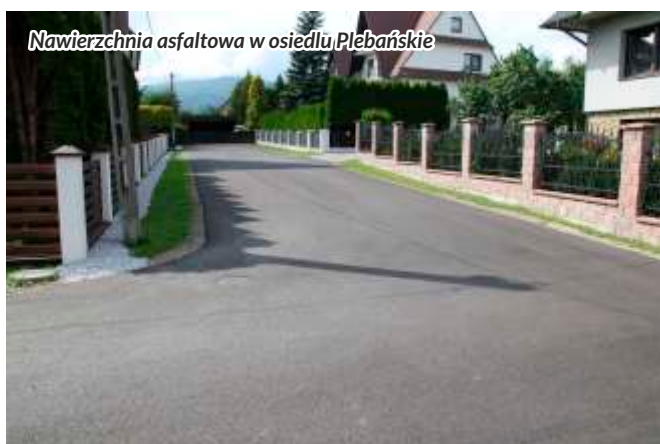
Nawierzchnia asfaltowa w osiedlu Plebańskie