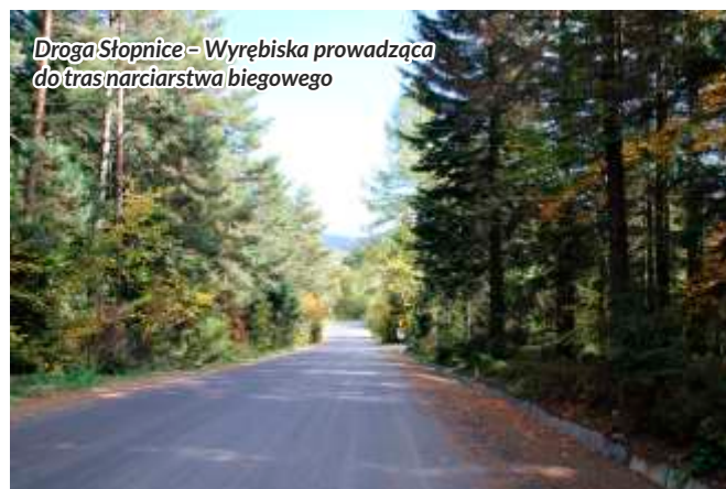
Droga Słopnice – Wyrębiska prowadząca do tras narciarstwa biegowego

Największą, a zarazem najdroższą okazała się być modernizacja drogi gminnej Słopnice –