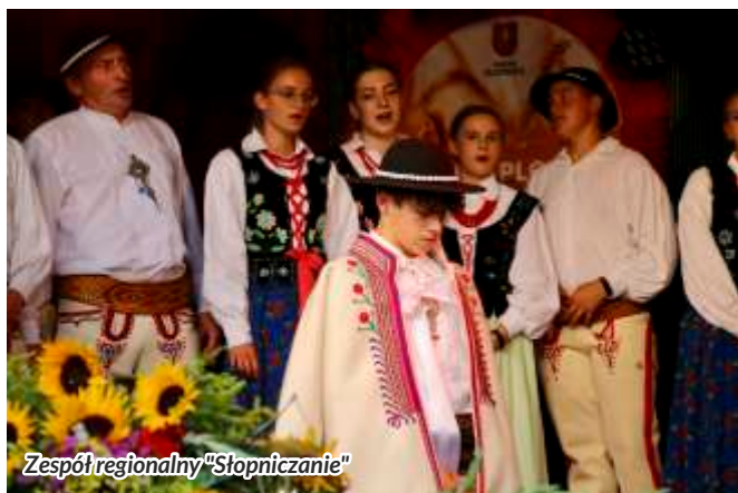
Zespół regionalny "Słopiczanie"