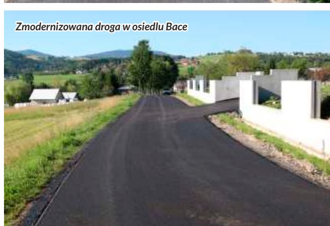
Zmodernizowana droga w osiedlu Bace

Wyrębiska, która prowadzi do tras narciarstwa biegowego i szlaków turystycznych wokół Mogielicy. Przedmiotowa droga została wyposażona w jezdnię o szerokości 7 mb., której część w przyszłości planuje