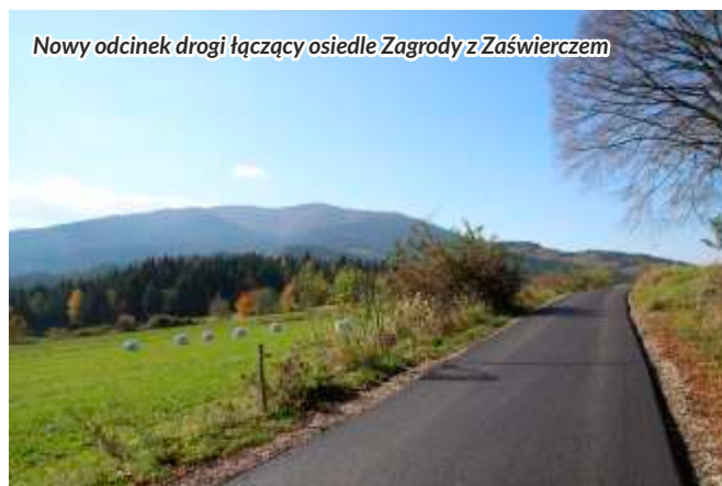
Nowy odcinek drogi łączący osiedle Zagrody z Zaświerczem

Niemal na wszystkich drogach wykonane zostały konieczne prace przygotowawcze oraz zabezpieczające w celu poprawy ich trwałości, tj.: wymiana i modernizacja zniszczonych elementów odwodnienia, wykonanie dodatkowej warstwy podbudowy, likwidacja przełomów. Ostatecznej oceny technicznej dróg dokonała komisja, która po wykonaniu badań kontrolnych nawierzchni drogowej (podbudowy zasadniczej, warstwy wiążącej, warstwy ścieralnej), uznała roboty za zrealizowane zgodnie z umową.