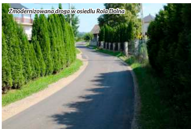
Zmodernizowana droga w osiedlu Rola Dolna