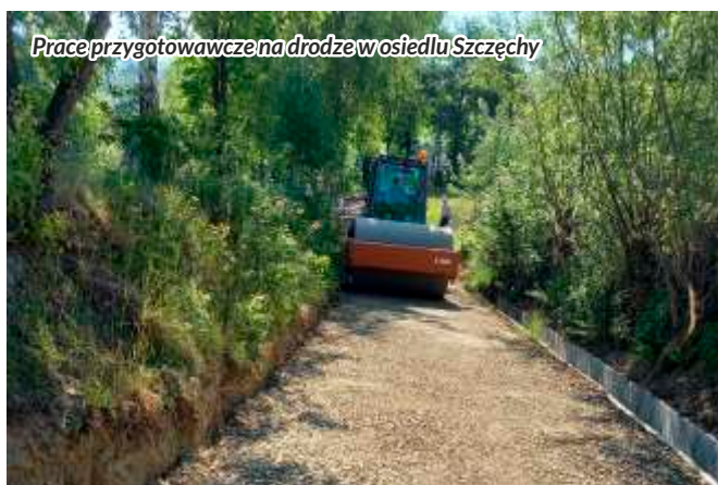
Prace przygotowawcze na drodze w osiedlu Szczęchy

W połowie listopada, oficjalnie zakończyła się historycznie największa inwestycja gminy Słupnice realizowana jednoetapowo. Zmodernizowano większość zniszczonych dróg na terenie gminy. Roboty polegały głównie na wykonaniu nowej nawierzchni asfaltowej w miejscu istniejącej – zniszczonej. W związku z prężnie rozwijającym się budownictwem mieszkaniowym, na terenie gminy powstały także nowe odcinki dróg.