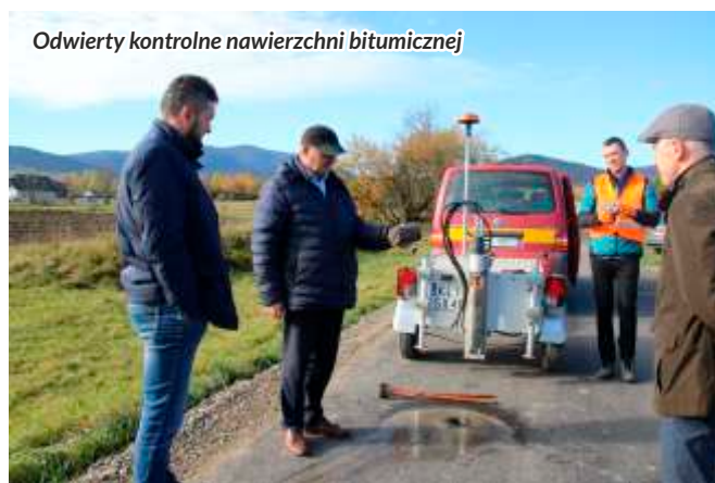
Odwierty kontrolne nawierzchni bitumicznej

Niemal na wszystkich drogach wykonane zostały konieczne prace przygotowawcze oraz zabezpieczające w celu poprawy ich trwałości, tj.: wymiana i modernizacja zniszczonych elementów odwodnienia, wykonanie dodatkowej warstwy podbudowy, likwidacja przełomów. Ostatecznej oceny technicznej dróg dokonała komisja, która po wykonaniu badań kontrolnych nawierzchni drogowej (podbudowy zasadniczej, warstwy wiążącej, warstwy ścieralnej), uznała roboty za zrealizowane zgodnie z umową.