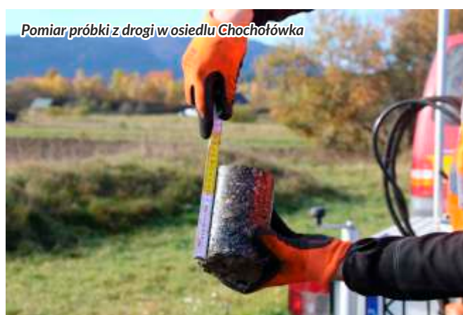
Pomiar próbki z drogi w osiedlu Chochotówka

Zakres przedmiotowy realizowanych prac objął modernizację 75 odcinków dróg na łącznej