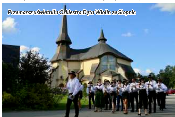
Przemarsz uświetniła Orkiestra Dęta Wiolin ze Słupnic

W korowodzie uczestniczyły delegacje mieszkańców ze Słupnic Górnych i Dolnych z darami owoców plonów, przedstawiciele władz gminy Słupnice, dyrektorzy szkół, zagraniczni goście z Węgier i Rumunii, delegacja zespołu Mali