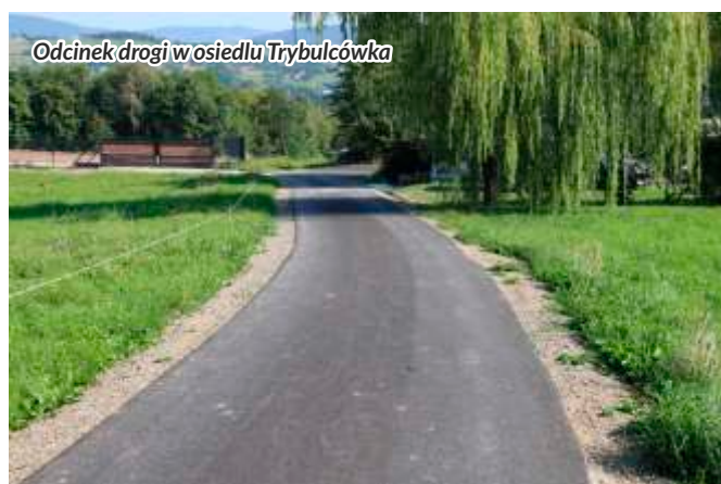
Odcinek drogi w osiedlu Trybulcówka

się wykorzystać w celach sportowo-rekreacyjnych. Koszt modernizacji drogi wyniósł 927 618 zł. Całość prac związanych z realizacją inwestycji infrastruktury drogowej zamyka się kwotą 9 469 545 zł. Na realizację tego zadania, gmina Słopnice uzyskała dofinansowanie w kwocie 6 650 000 zł z Rządowego Funduszu Polski Ład: Programu Inwestycji Strategicznych. Kwota ta stanowi 70,2% kosztów zadania. Pozostała część została pokryta ze środków własnych gminy. Ponadto, modernizacji poddano drogę Piechotówka na odcinku bezpośrednio przylegającym do gminy Kamienica.