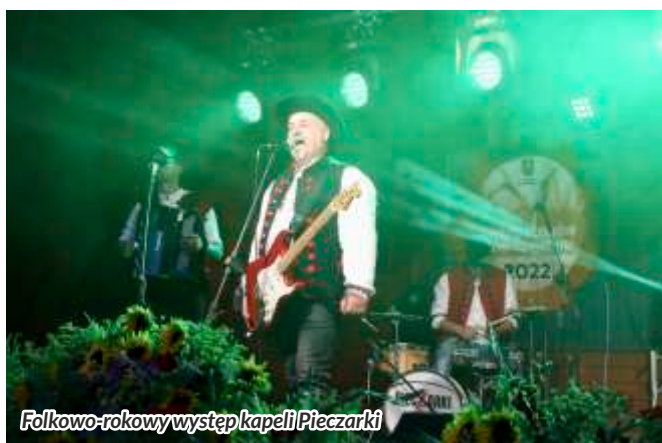
Folkowo-rockowy występ kapeli Pieczarki