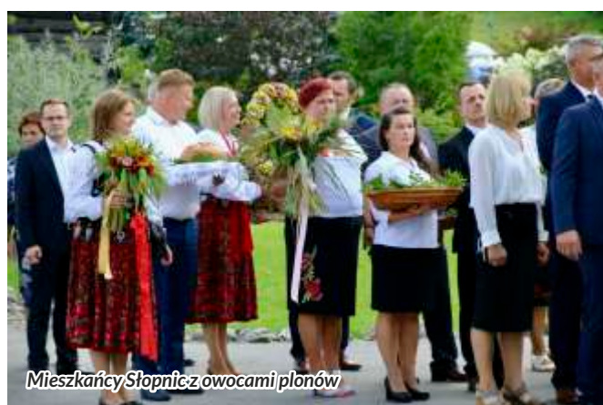
Mieszkańcy Słupnic z owocami plonów

W korowodzie uczestniczyły delegacje mieszkańców ze Słupnic Górnych i Dolnych z darami owoców plonów, przedstawiciele władz gminy Słupnice, dyrektorzy szkół, zagraniczni goście z Węgier i Rumunii, delegacja zespołu Mali