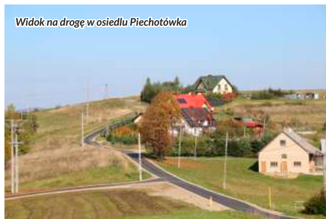
Widok na drogę w osiedlu Piechotówka