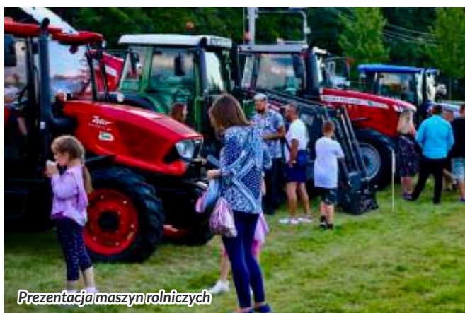
Prezentacja maszyn rolniczych

Wójt Gminy Słopnice składa serdeczne podziękowania wszystkim osobom i organizacjom zaangażowanym w przygotowanie Święta Plonów Gminy Słopnice. Mieszkańcom zaś, za miłą atmosferę i dobrą, spokojną zabawę.