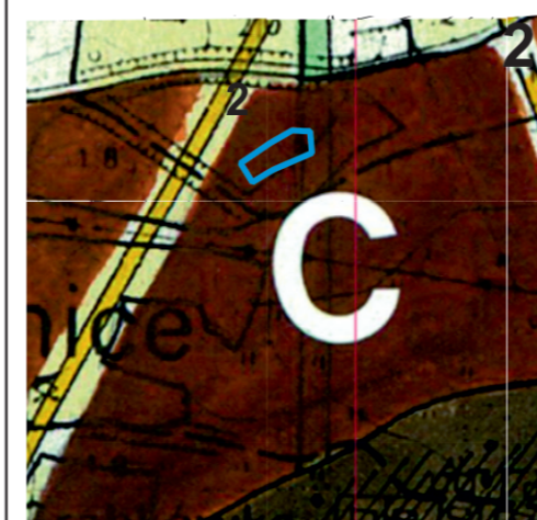
Wrysy ze studium uwarunkowań i kierunków zagospodarowania przestrzennego Gminy Słopnice, uchwalonego uchwałą Nr XII/86/99 Rady Gminy Słopnice z dnia 29.12.1999r